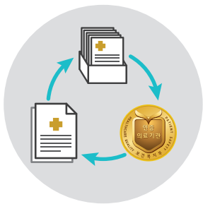
업무 연속성 유지