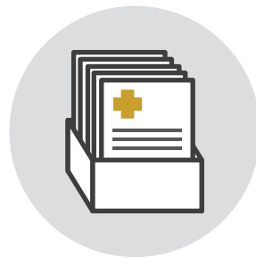
복잡한 문서 관리