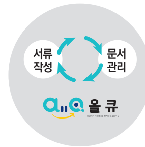
의료기관 인증평가 올큐로 대응