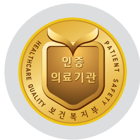
의료기관 인증평가 통과