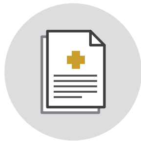
의료기관 인증평가 서류

QPS & 감염관리 EMR 솔루션은 Quality improvement & Patient Safety & Infection Management & Electronic Medical Record solution System의 줄임말로 의료기관의 환자안전, 질향상, 감염관리의 EMR 솔루션 시스템의 명칭입니다.